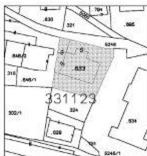
estratto mappa scala 1:1000