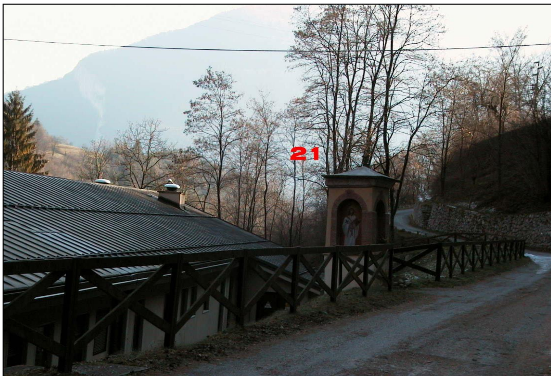
Unità Minima d'intervento n° 21