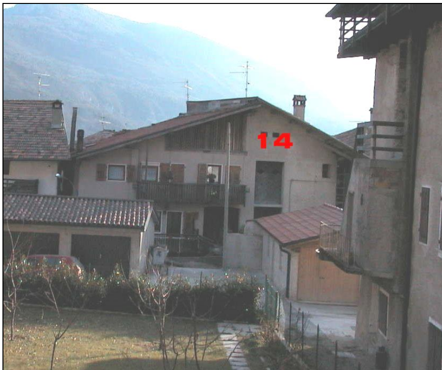
Unità Minima d'intervento n° 14