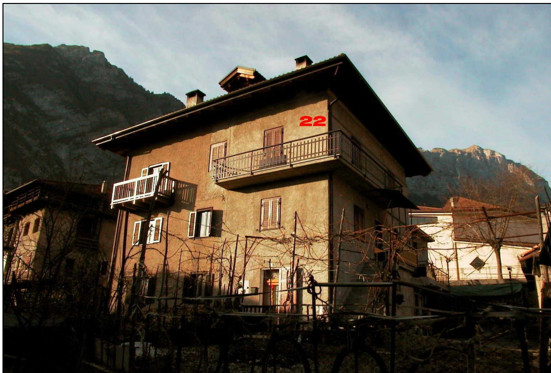
Unità Minima d'intervento n° 22