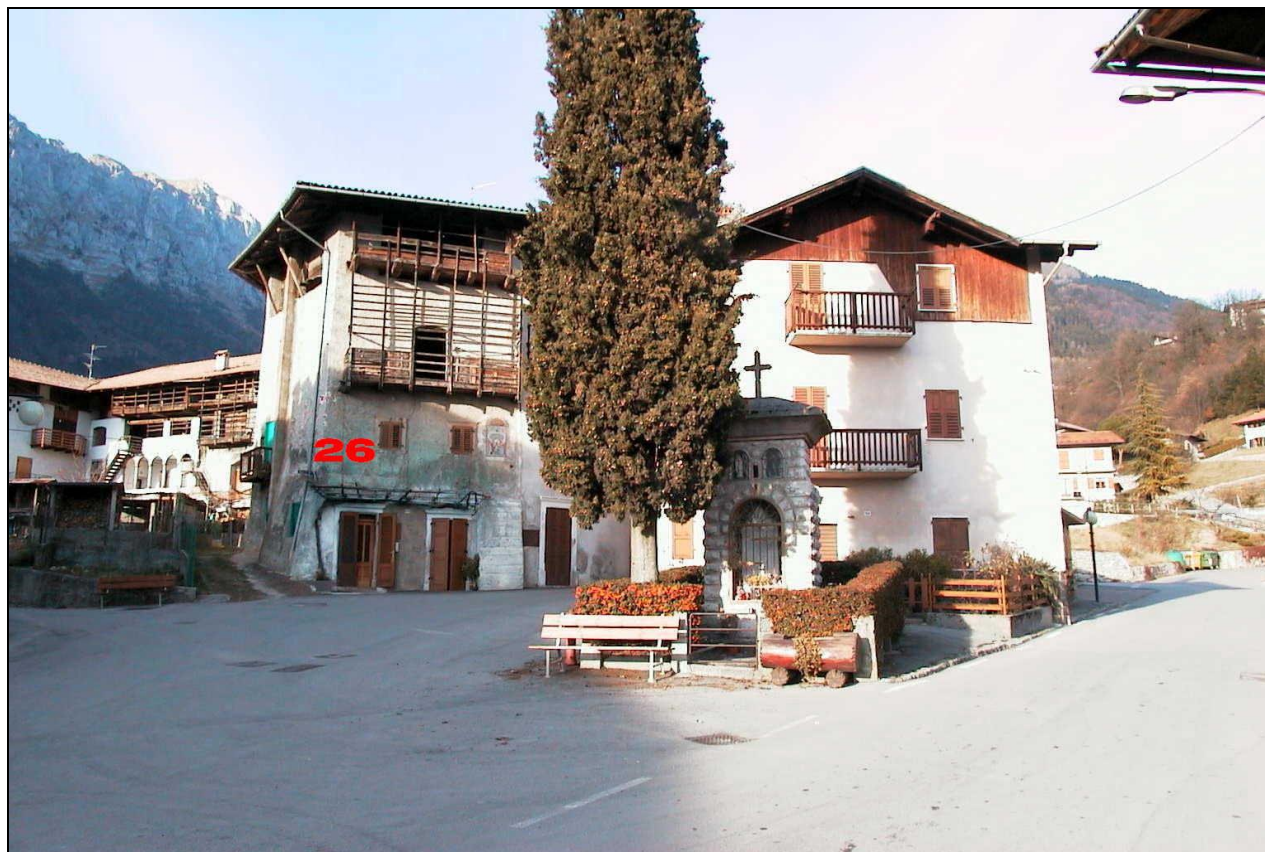
Unità Minima d'intervento n° 26