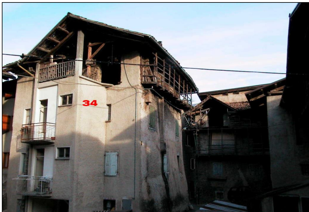
Unità Minima d'intervento n° 34