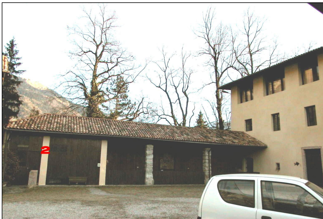
Unità Minima d'intervento n° 2