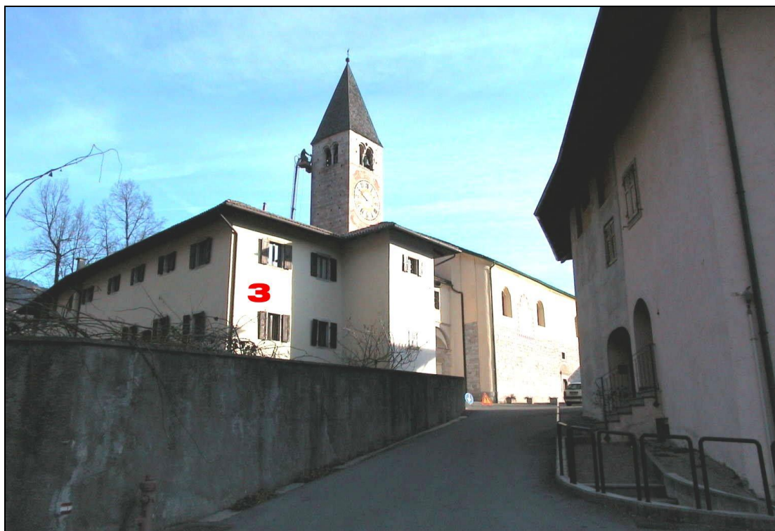
Unità Minima d'intervento n° 3