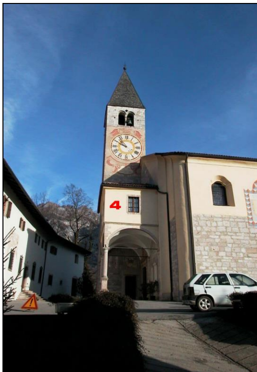
Unità Minima d'intervento n° 4