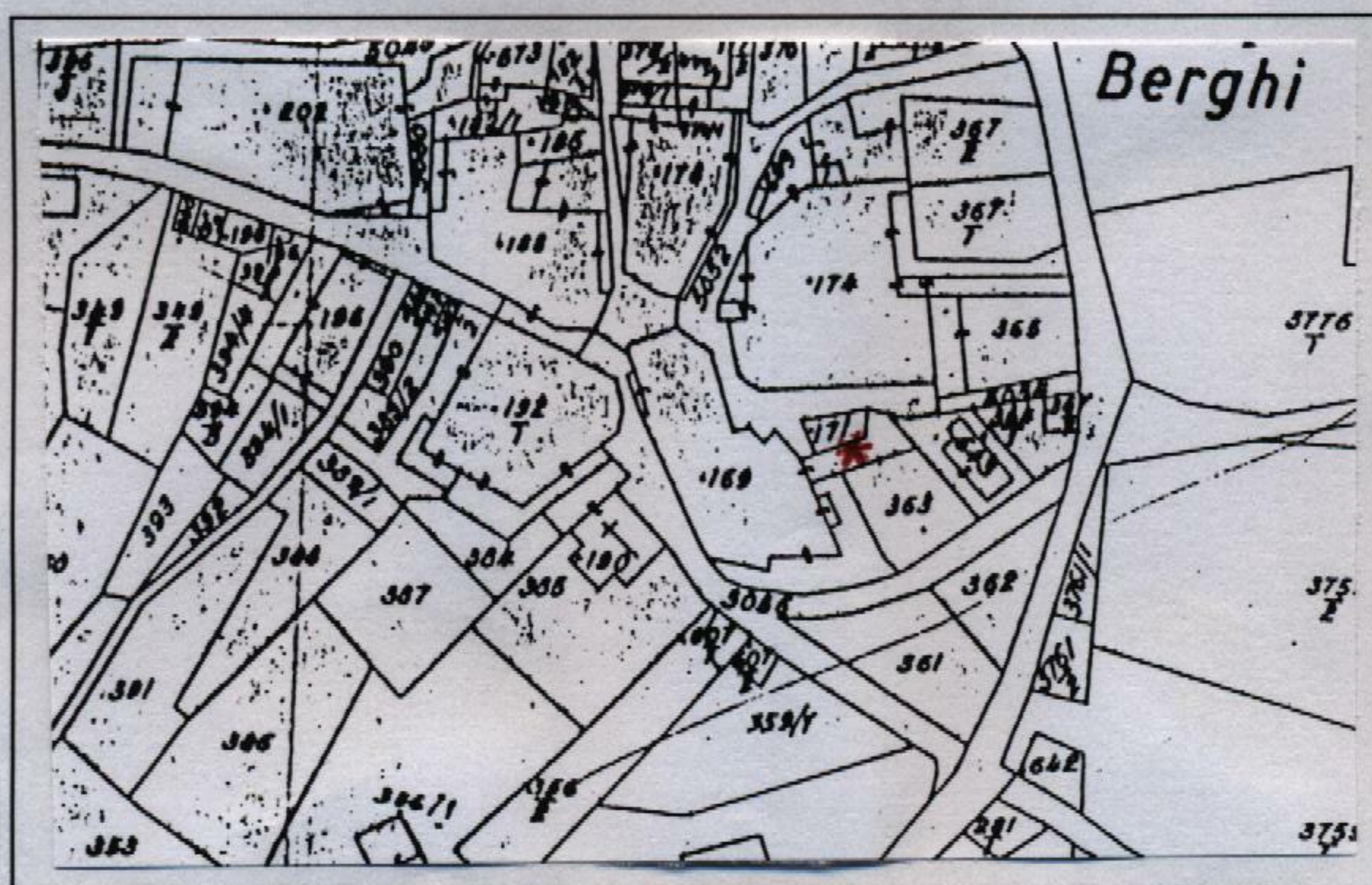
Estratto catastale in scala 1: 1.440