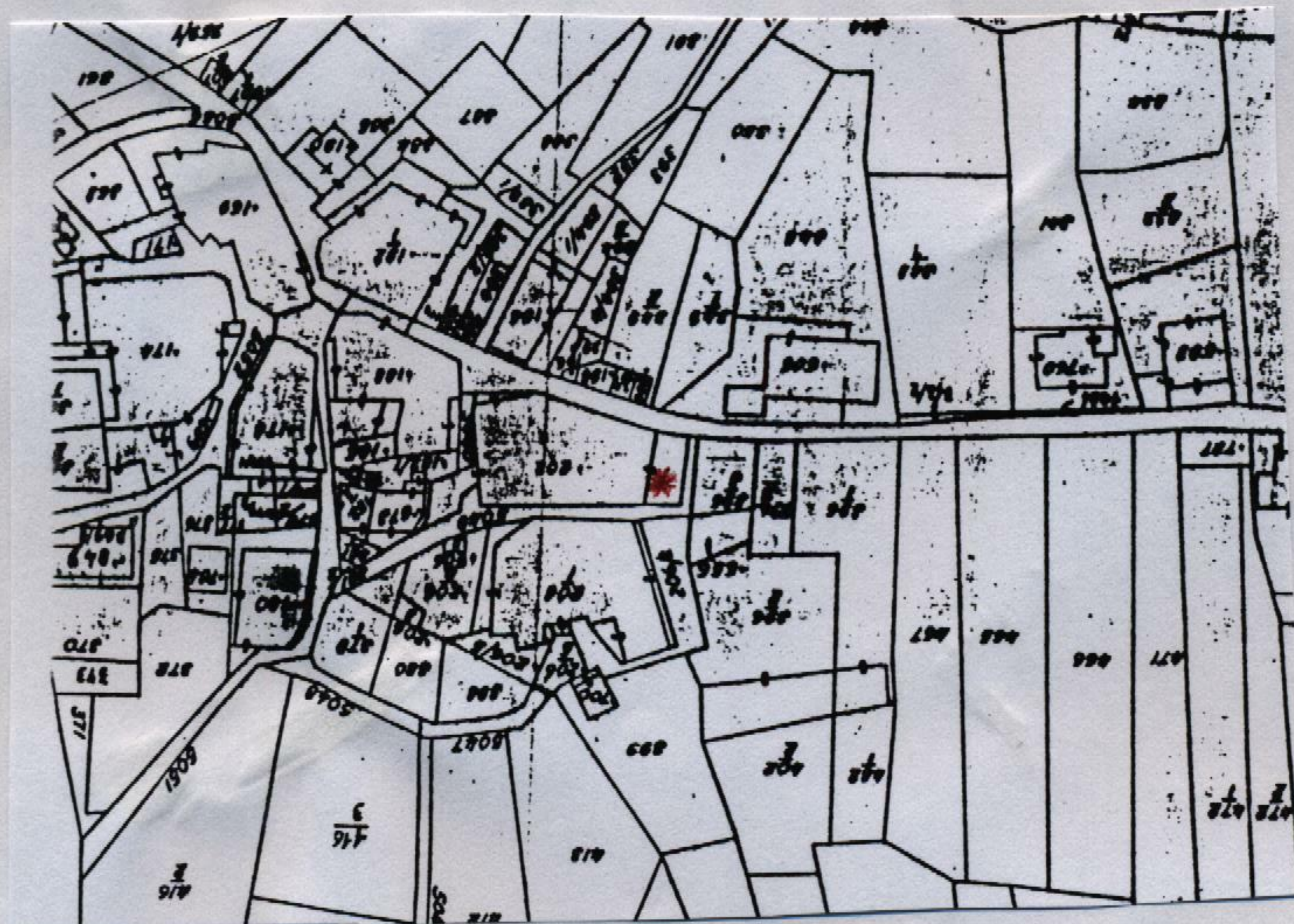
Estratto catastale in scala 1: 1.440