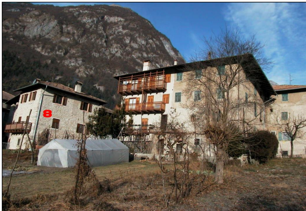
Unità Minima d'intervento n° 8