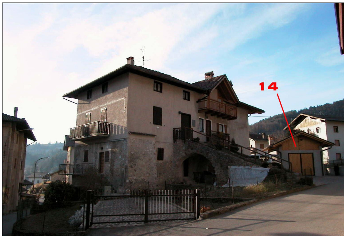
Unità Minima d'intervento n° 14