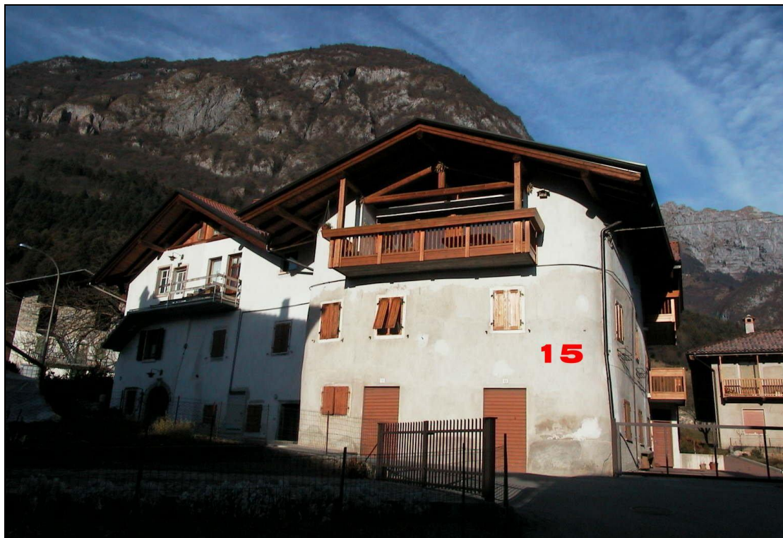
Unità Minima d'intervento n° 15