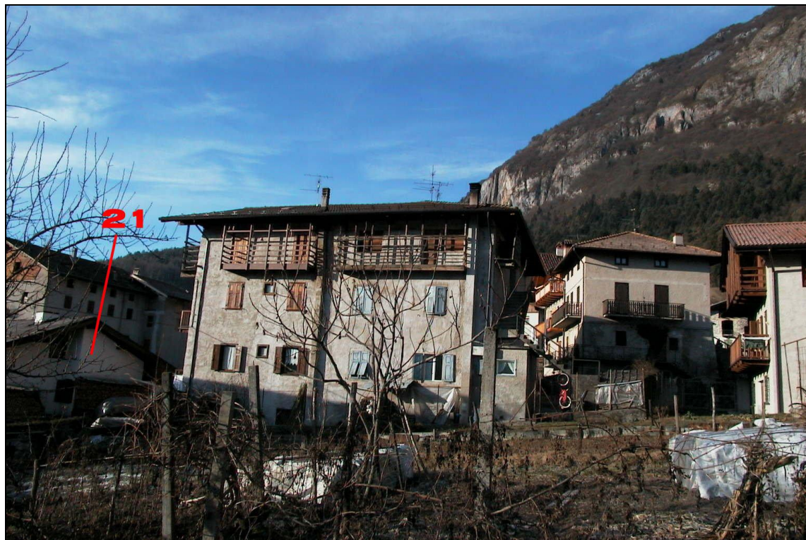
Unità Minima d'intervento n° 21