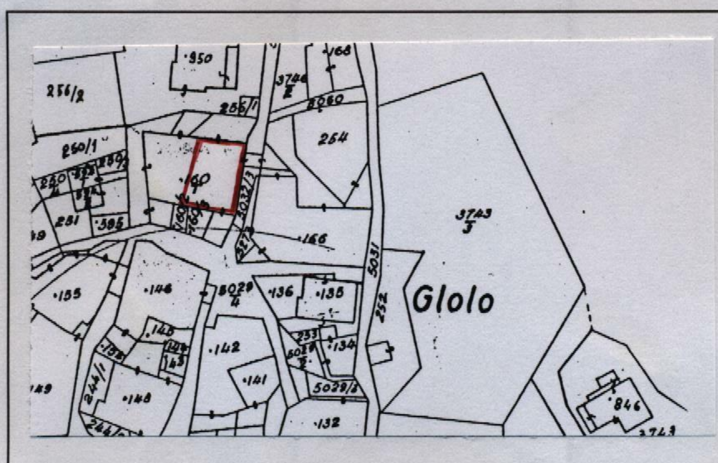
Estratto catastale in scala 1: 1.440