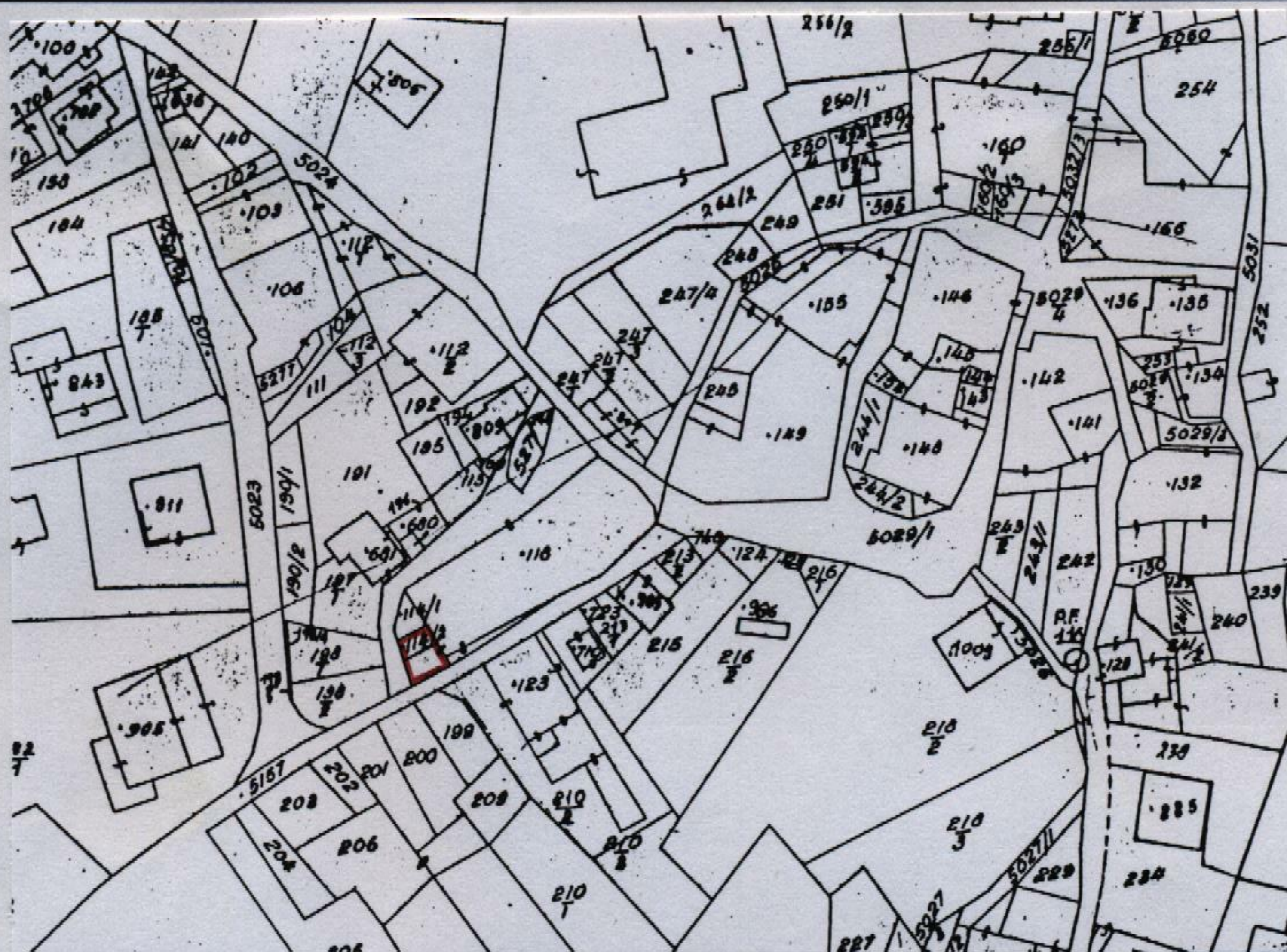
Estratto catastale in scala 1: 1.440