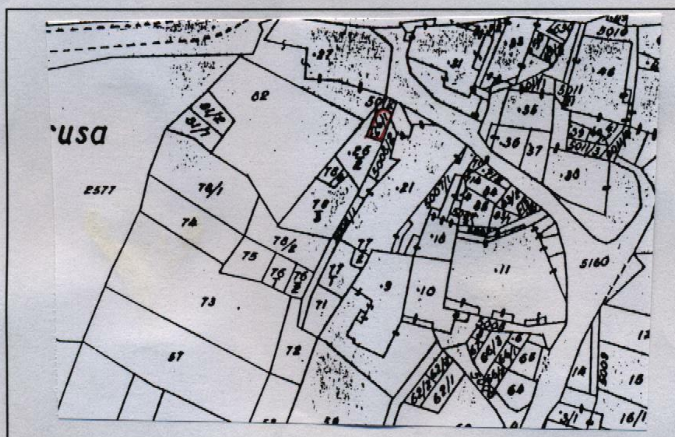
Estratto catastale in scala 1: 1.440