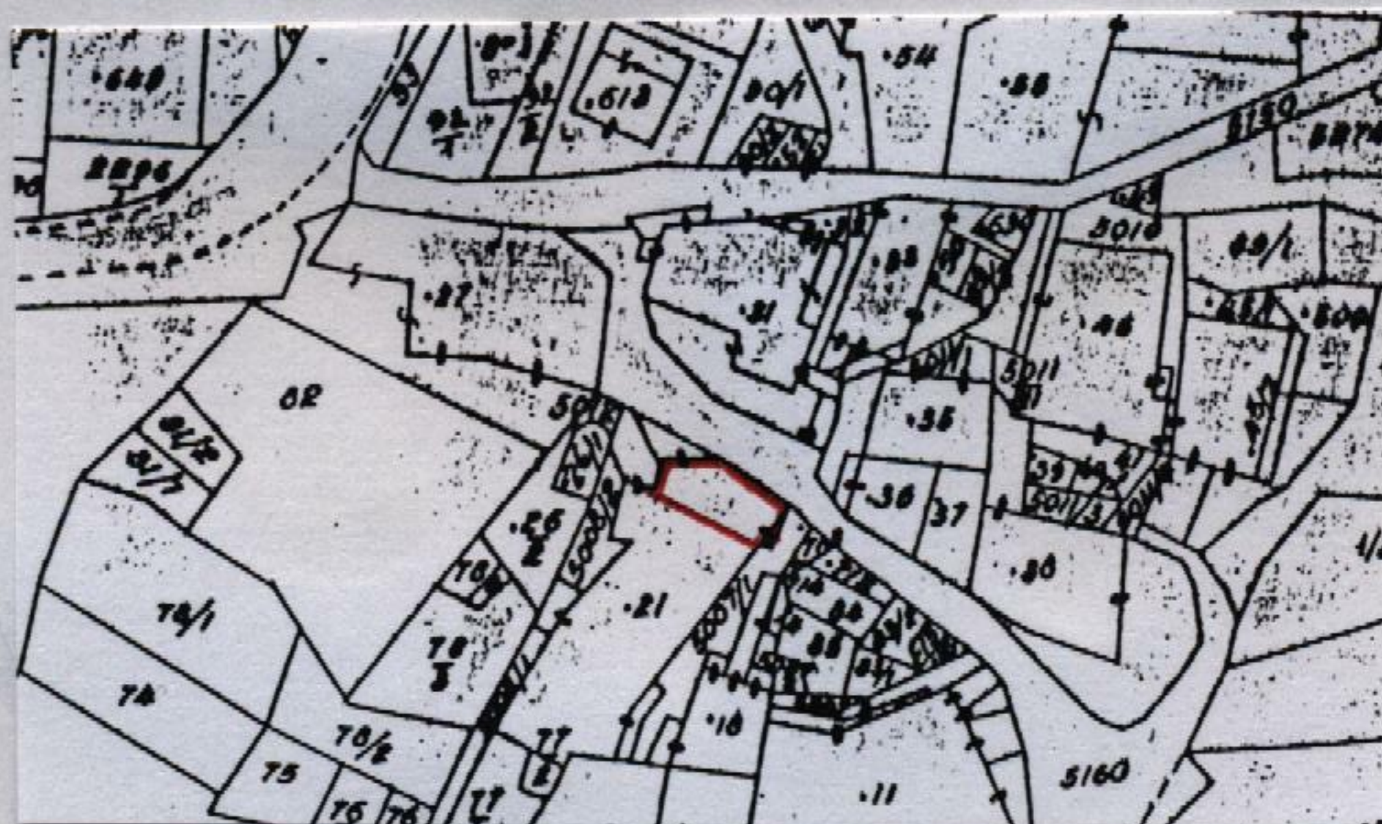
Estratto catastale in scala 1: 1.440