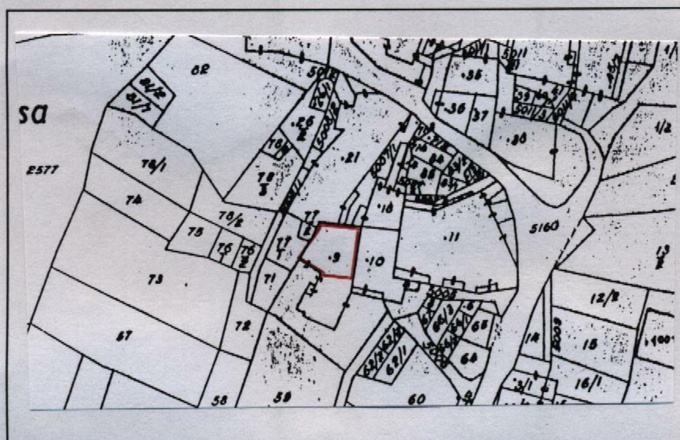
Estratto catastale in scala 1: 1.440