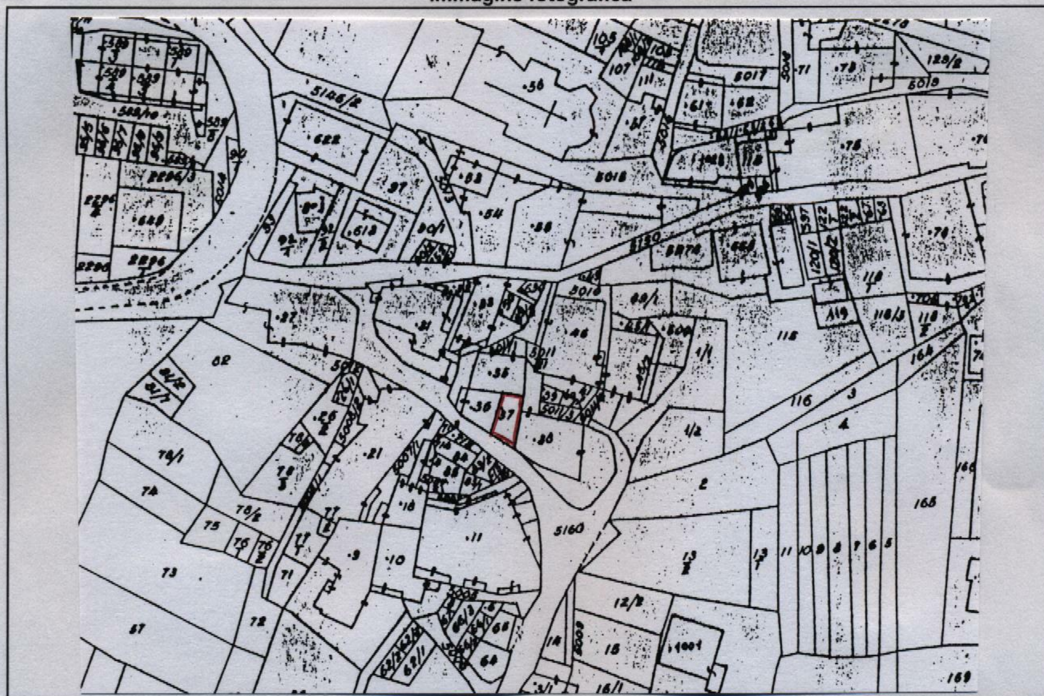
Estratto catastale in scala 1: 1.440