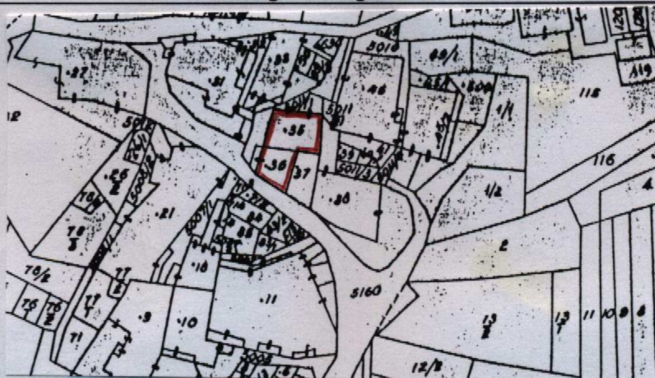
Estratto catastale in scala 1: 1.440