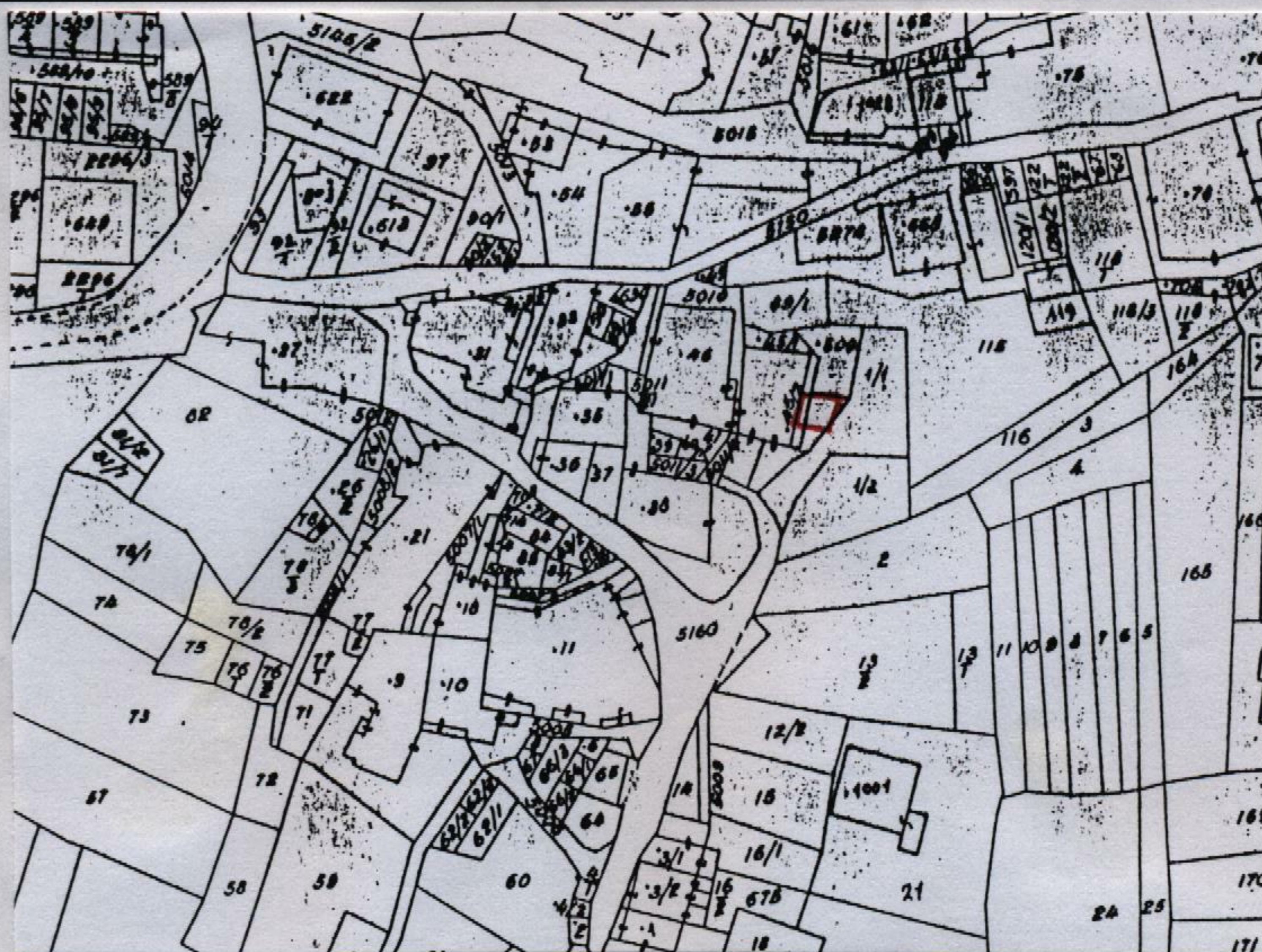
Estratto catastale in scala 1: 1.440