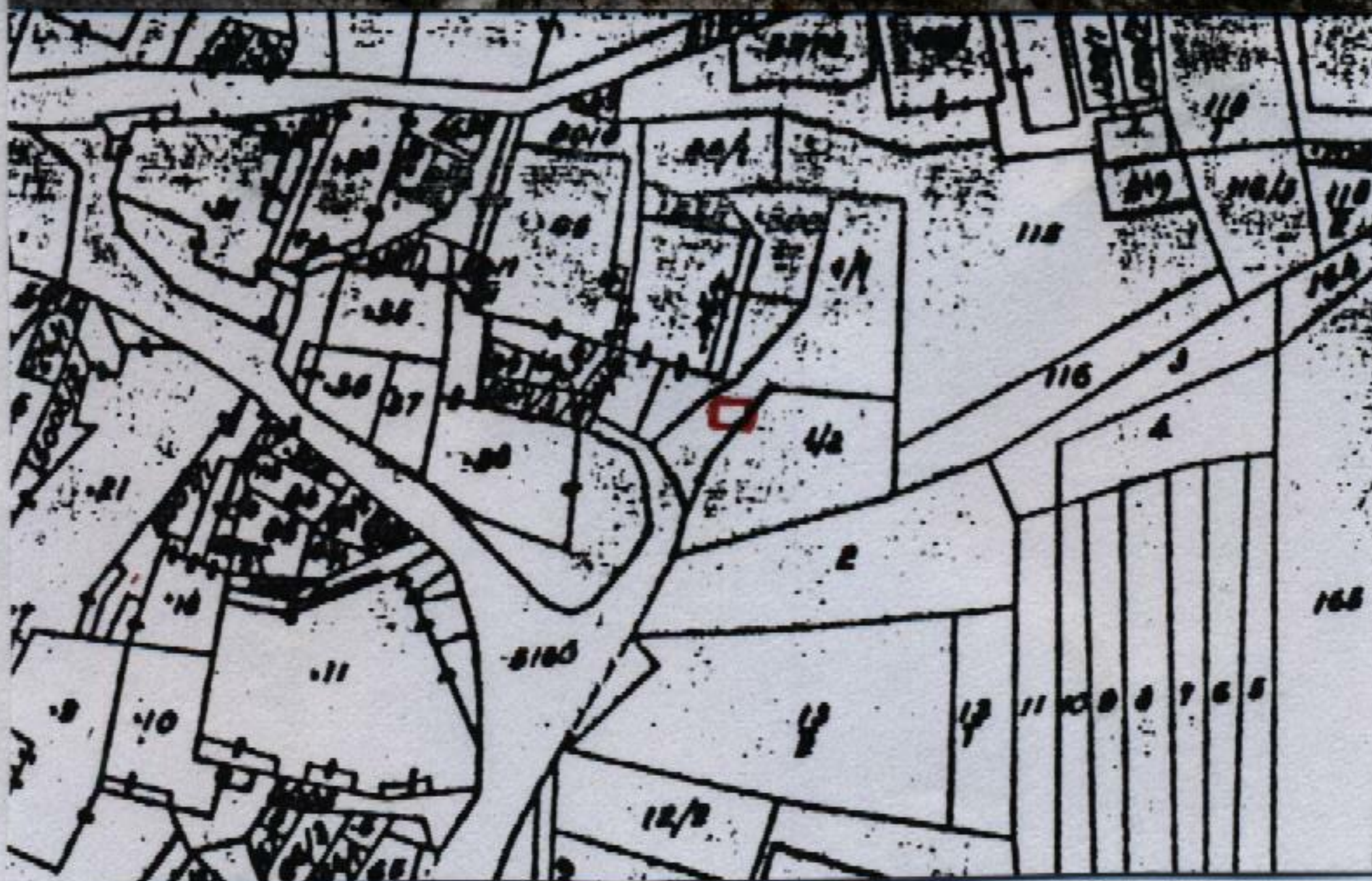
Estratto catastale in scala 1: 1.440