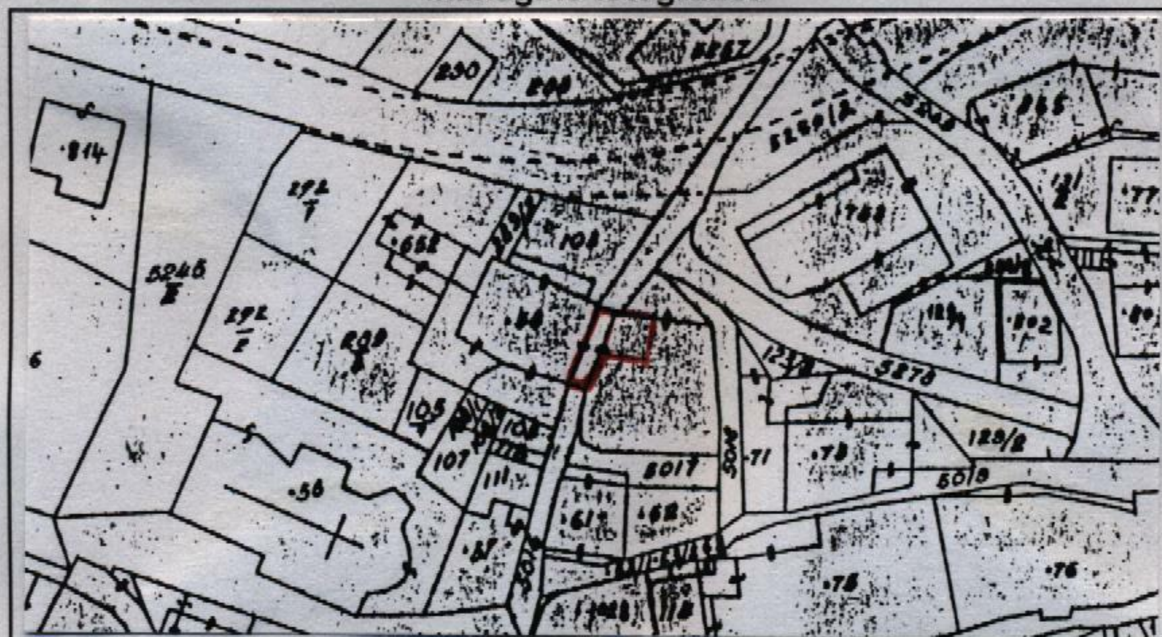
Estratto catastale in scala 1: 1.440