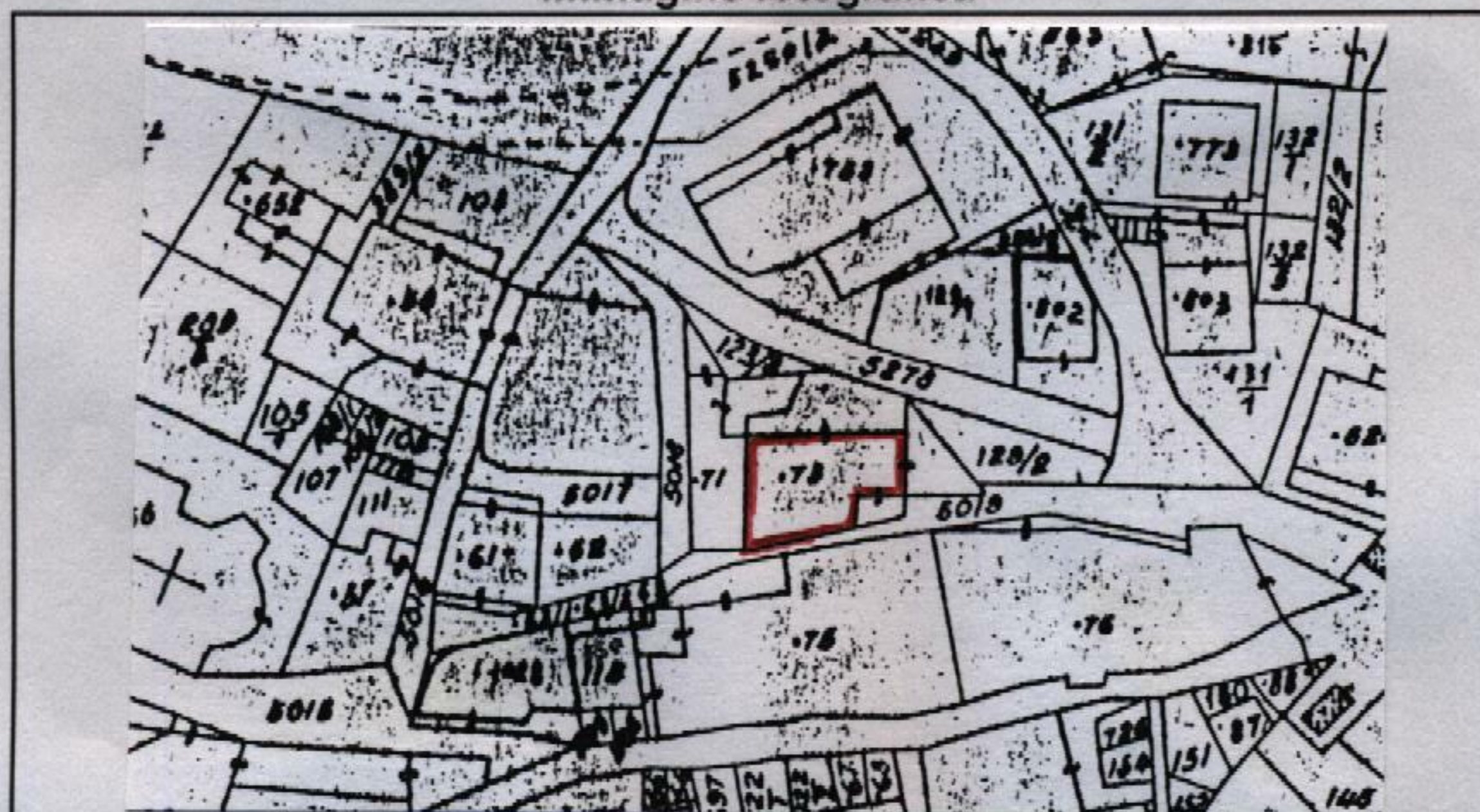
Estratto catastale in scala 1: 1.440