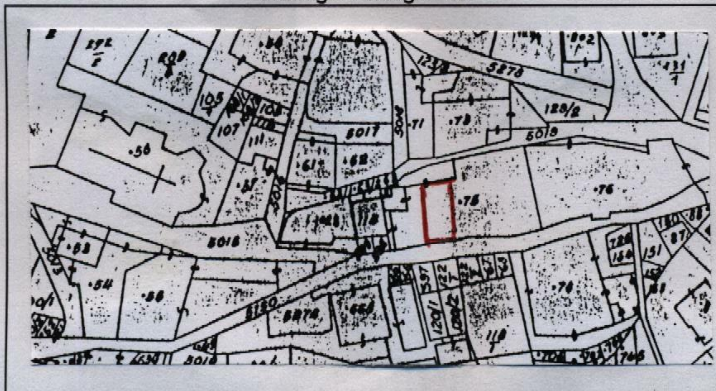
Estratto catastale in scala 1: 1.440