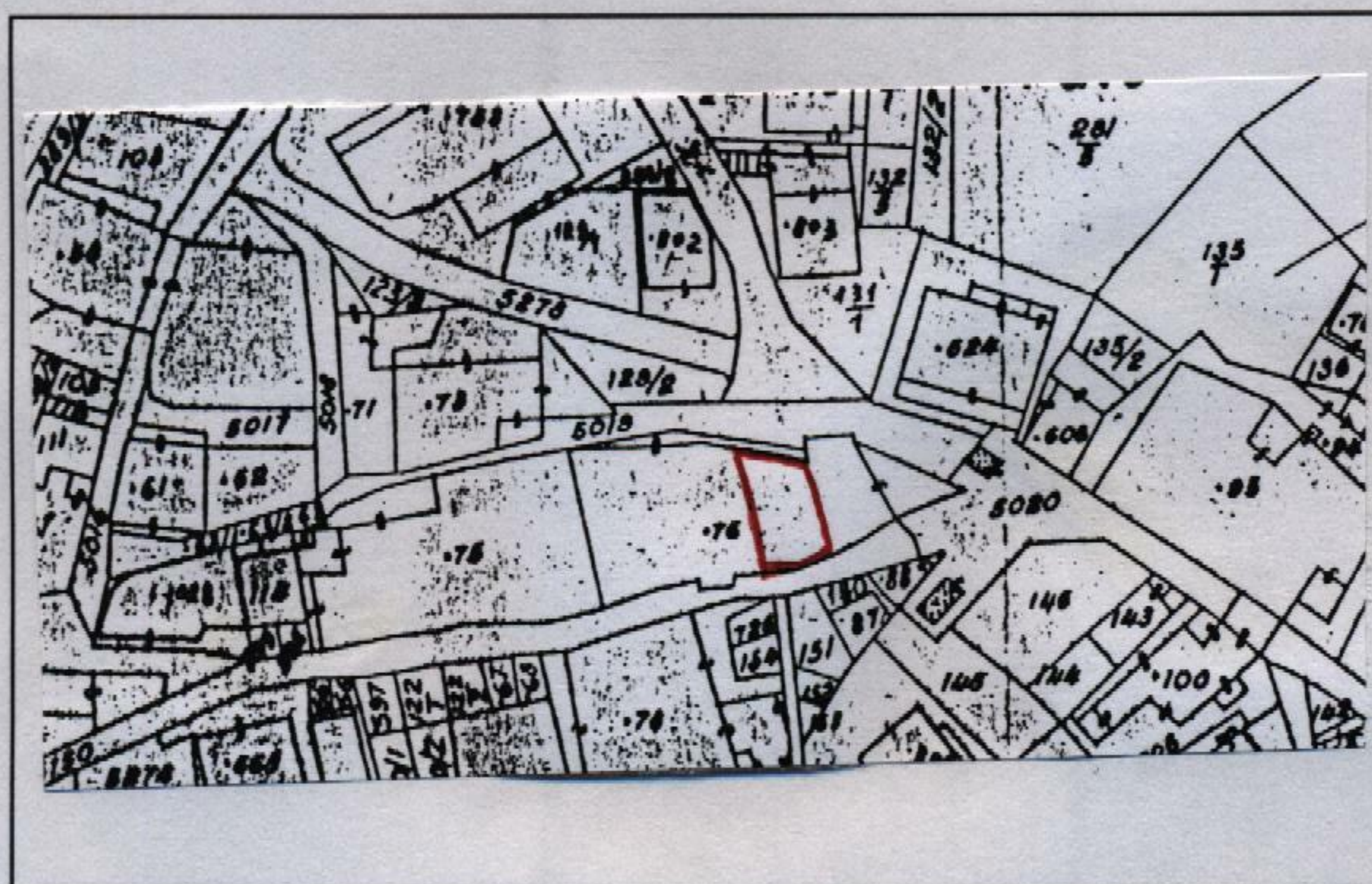
Estratto catastale in scala 1: 1.440