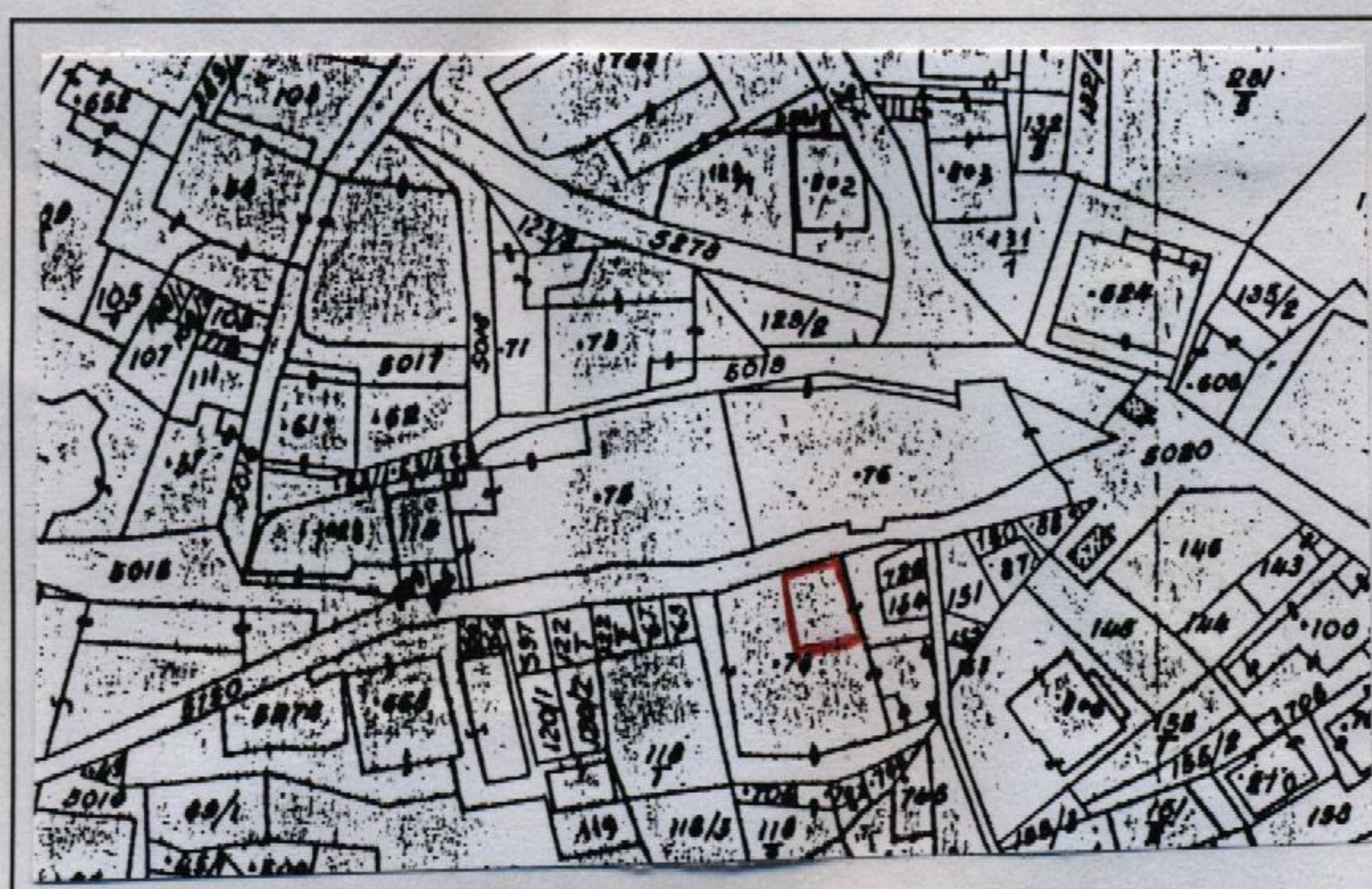
Estratto catastale in scala 1: 1.440