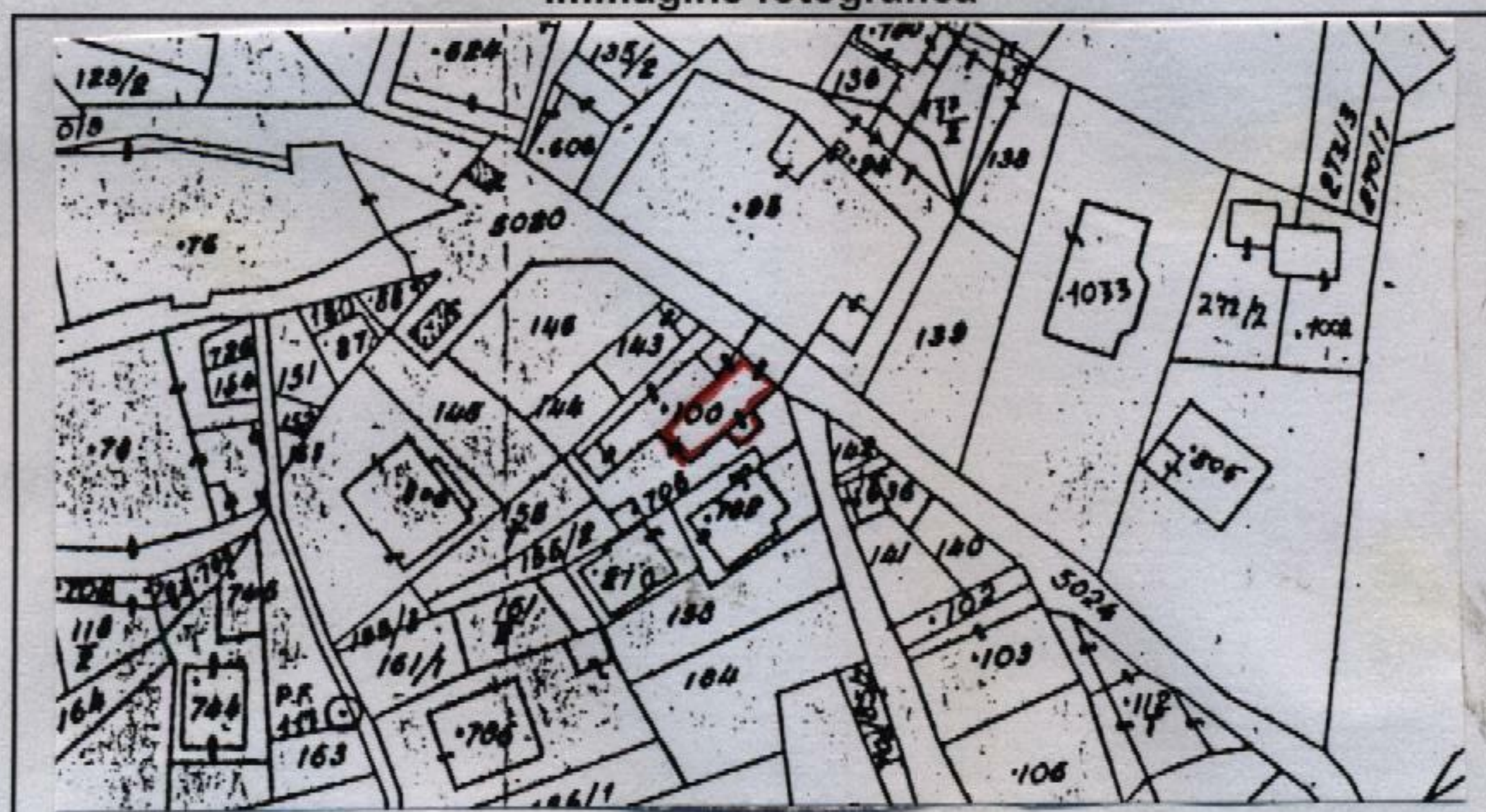
Estratto catastale in scala 1: 1.440