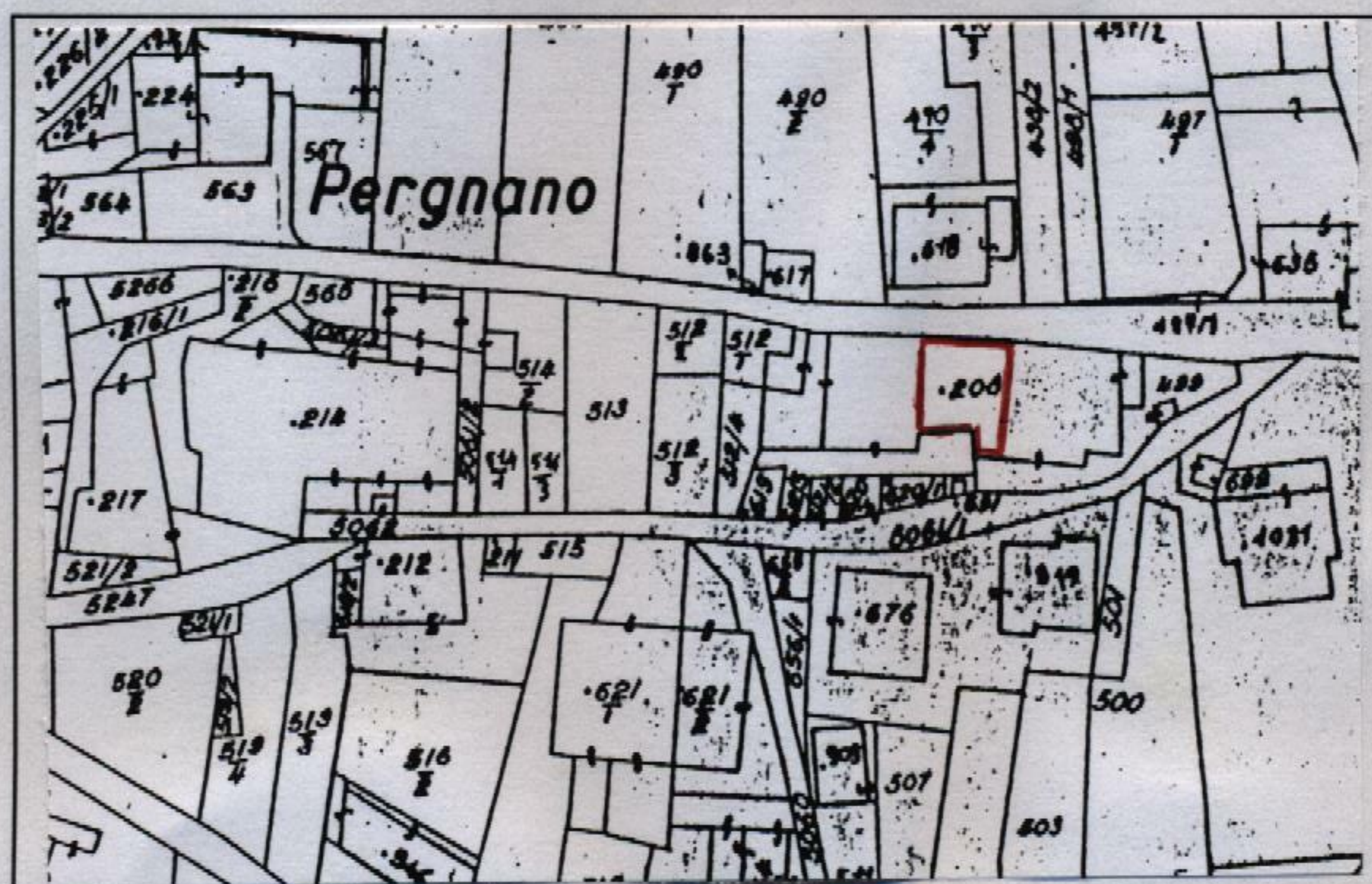
Estratto catastale in scala 1: 1.440