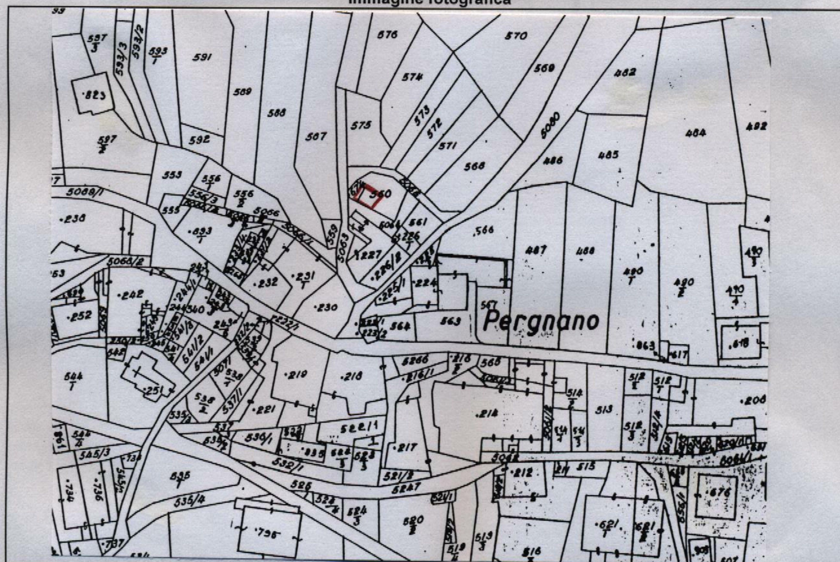
Estratto catastale in scala 1: 1.440