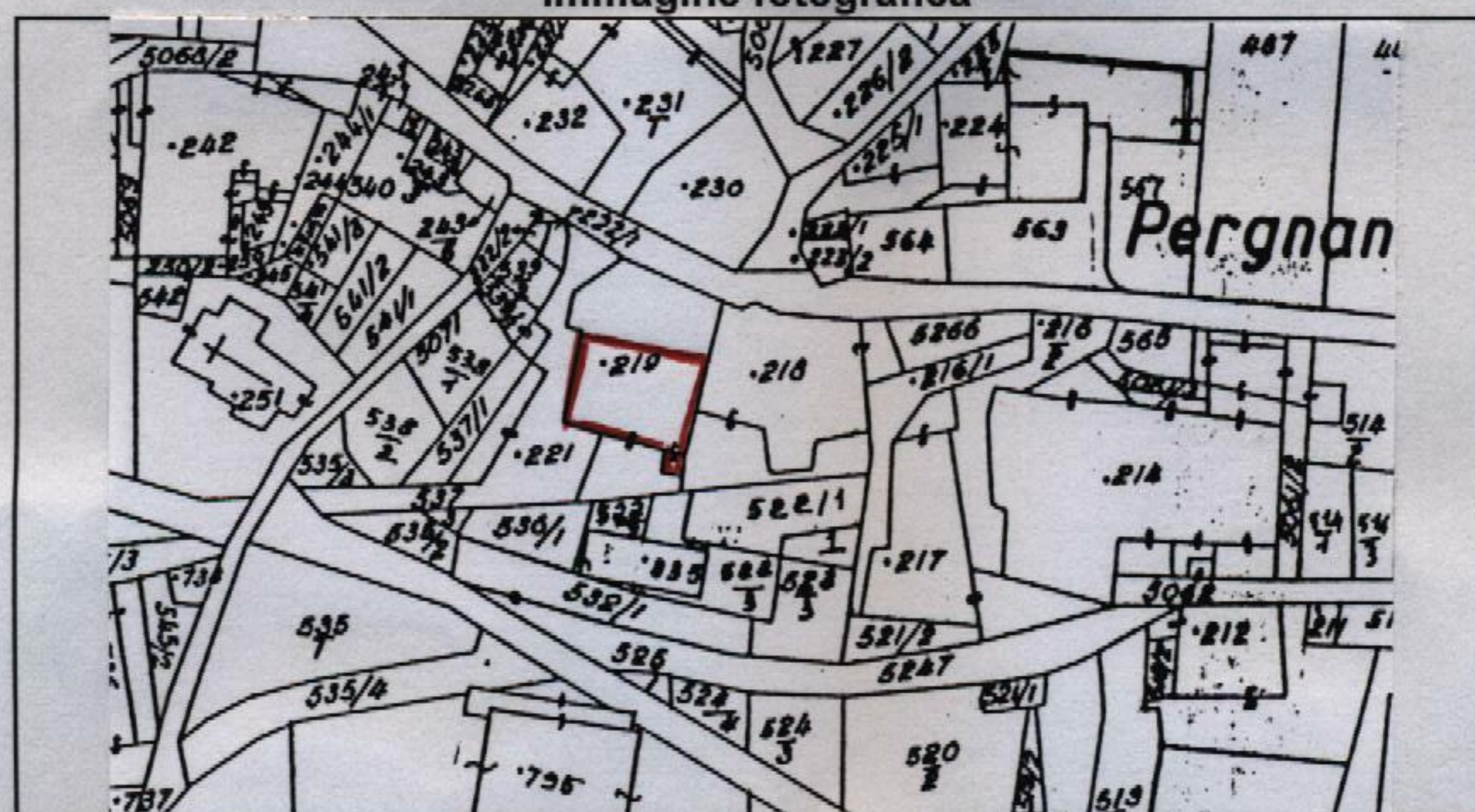
Estratto catastale in scala 1: 1.440