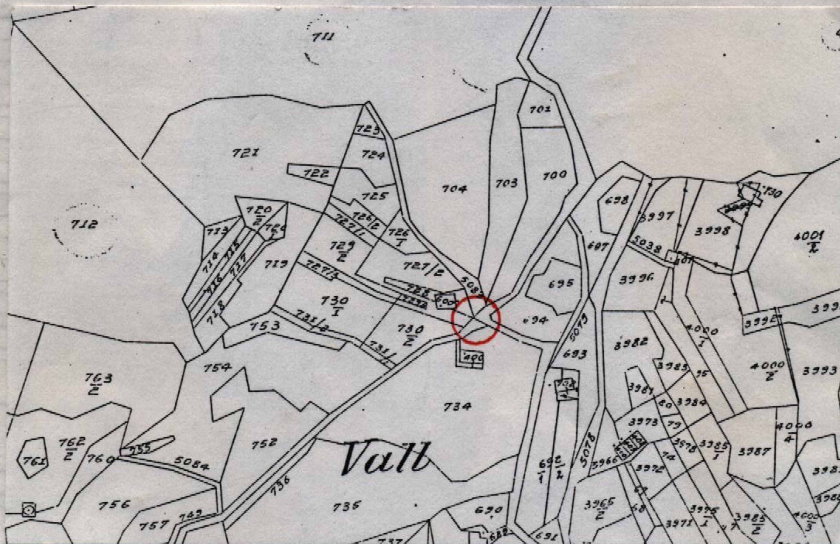
Estratto catastale in scala 1: 2.880