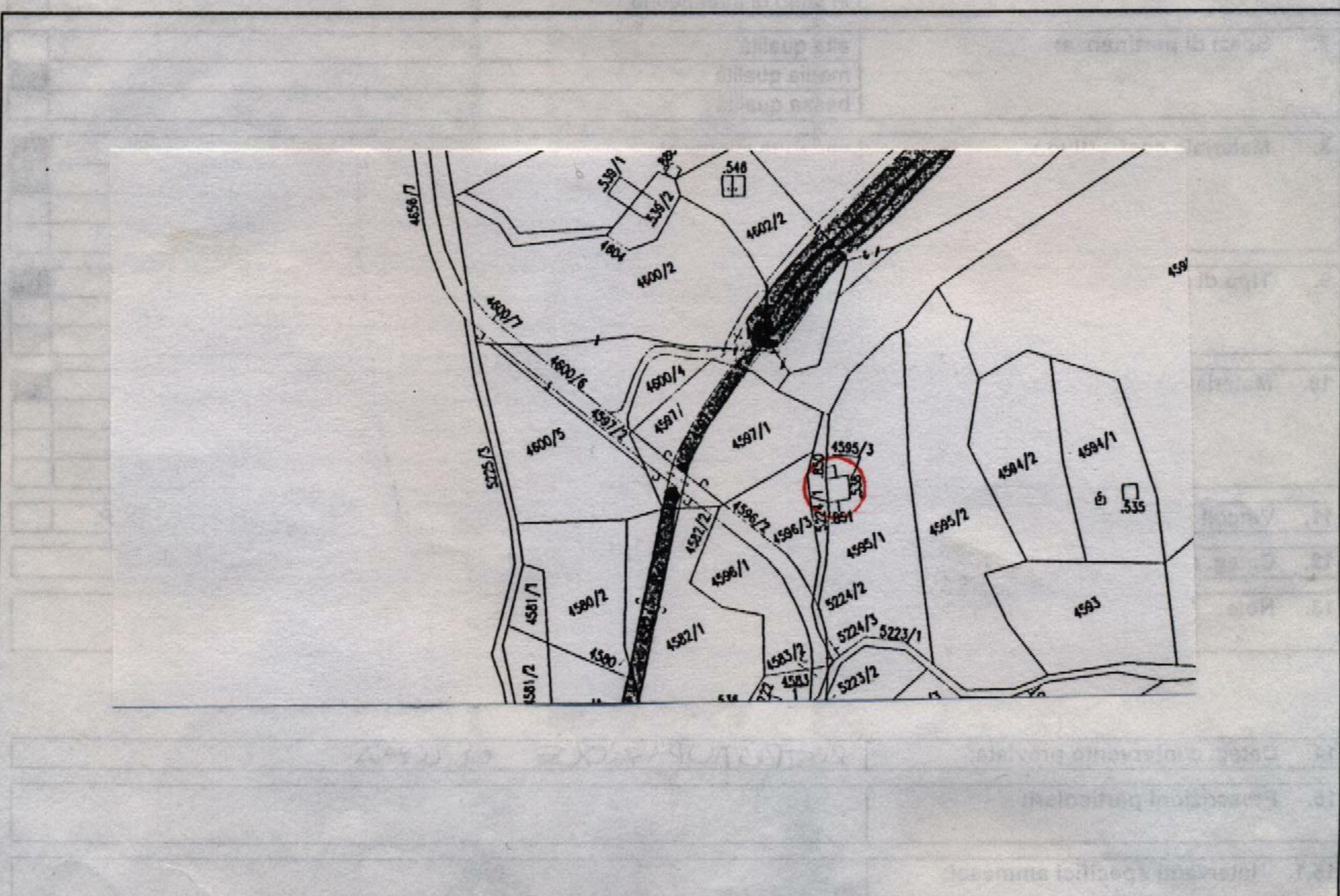
Estratto catastale in scala 1: 2.880