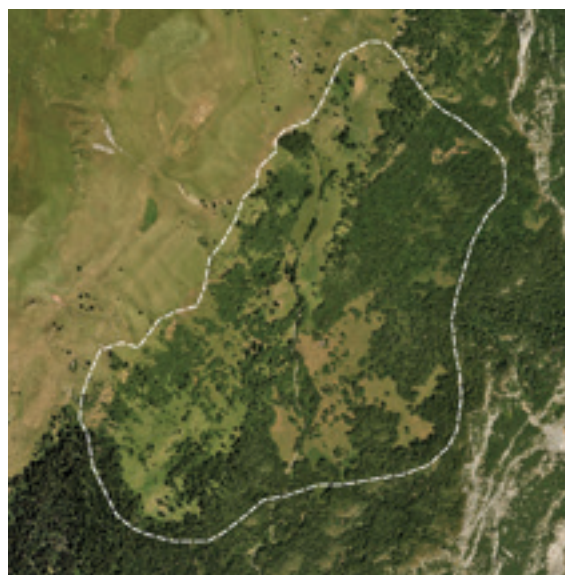
Ortofoto località Prada 2015