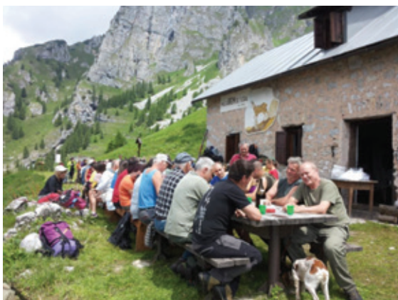
Messa e pranzo. Ben luglio 2014

a cura del Direttivo Sezione Cacciatori San Lorenzo