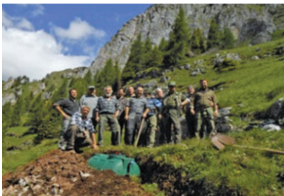
Acqua Ben 2012

L a sezione Cacciatori di S. Lorenzo anche quest'anno ha svolto diverse attività in ambito venatorio e non: in primavera con censimenti notturni/diurni a capriolo e cervi (questi in forte aumento sul nostro territorio) e in estate, verso i primi di agosto al camoscio, questo non con poche difficoltà visto il nostro vasto territorio in alta quota.