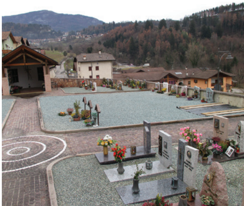
Cimitero Dorsino: spazio per 5 anni

E questo non solo qui da noi: nella relazione che il difensore civico presenta al consiglio provinciale annualmente la nostra vicenda delle aree sature ha trovato ampia