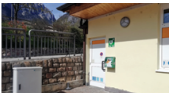
Famiglia Cooperativa di Dorsino