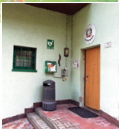
Caserma dei Carabinieri di San Lorenzo

Per quanto riguarda il paese di Dorsino, il defibrillatore si trova all'esterno della Famiglia Cooperativa.