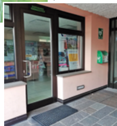
Farmacia di San Lorenzo

A Tavodo il DAE è installato dietro la fontana presente nel centro del paese, mentre ad Andogno è collocato in piazza.