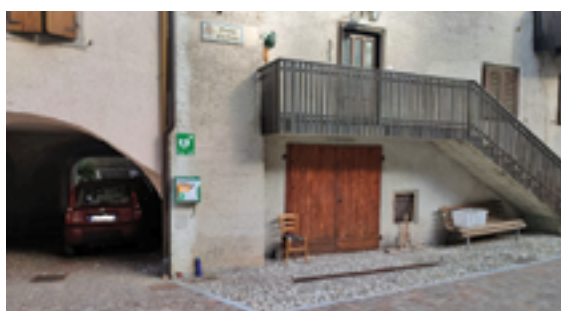
Piazza di Andogno